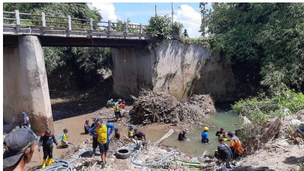
a. Kerja bakti Pembersihan Sungai Sampah Dangkel Bambu di Jembatan Tangkilan desa Karangmojo