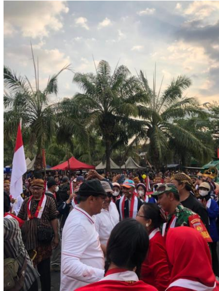
j. Kegiatan Bantuan Telur Atasi Stunting oleh Penyuluh KB Karanganyar