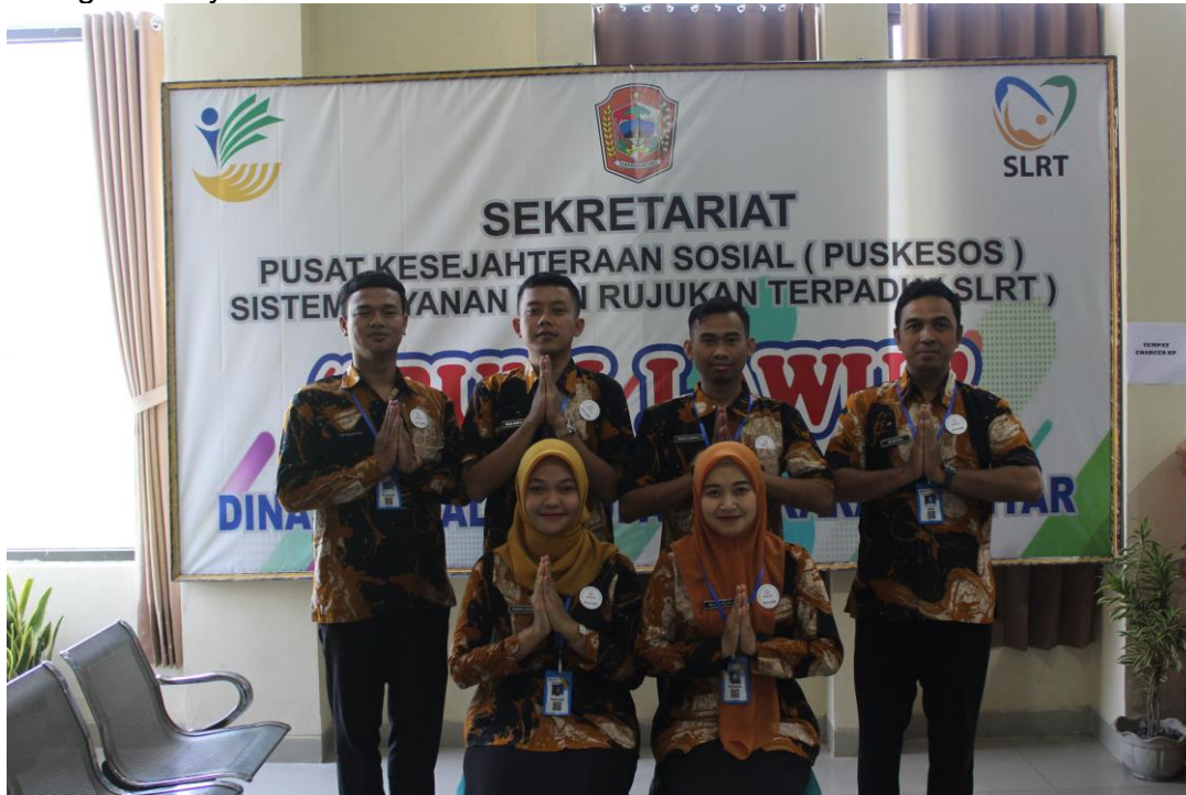
Ruang Pelayanan PBI/KIS