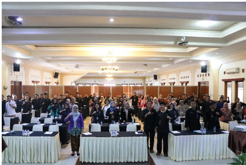
1.0 Aksi Konvergensi Bangda.