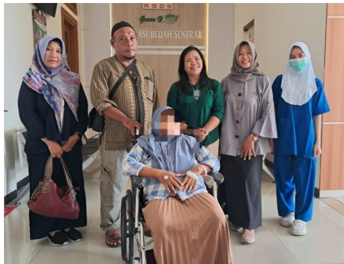
1.1 Pelayanan MOW dan MOP di masyarakat.