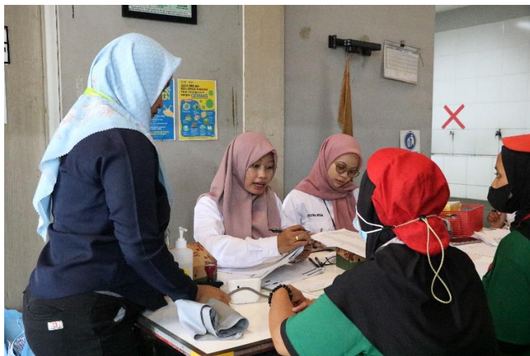
1.2. Pelayanan KB.