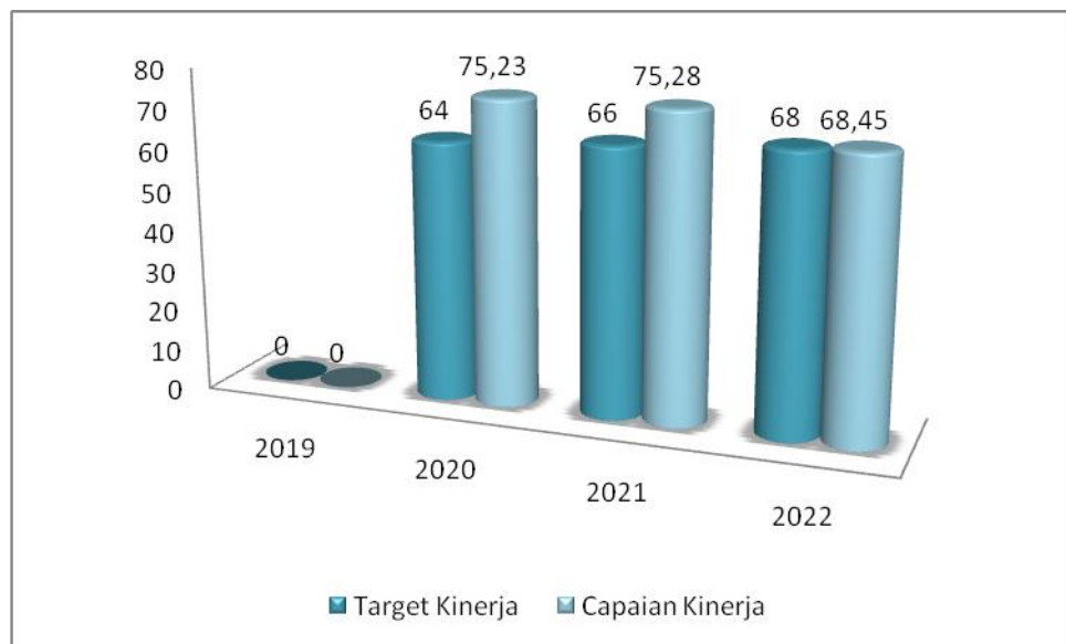
Grafik 3.2.1 Perbandingan Capaian Indikator Kinerja Utama Nilai SAKIP Tahun 2019 - 2022

Dengan capaian tersebut maka pada tahun 2023 nilai SAKIP Kecamatan Jaten belum mencapai target yang ditentukan. Nilai SAKIP yang dibandingkan adalah nilai SAKIP yang diperoleh dari review atau penilaian dari Inspektorat Daerah pada tahun 2022 karena untuk laporan kinerja Kecamatan Jaten tahun 2023 belum ada review atau penilaian dari Inspektorat. Keberhasilan yang telah dicapai pada tahun 2023 ini menunjukkan bahwa kinerja Kecamatan Jaten sudah baik. Hal ini menjadi tolak ukur bahwa program, kegiatan dan sub kegiatan yang dilaksanakan sesuai dengan target yang telah ditentukan. Program, kegiatan dan sub kegiatan ini mendukung tercapainya target kinerja utama.