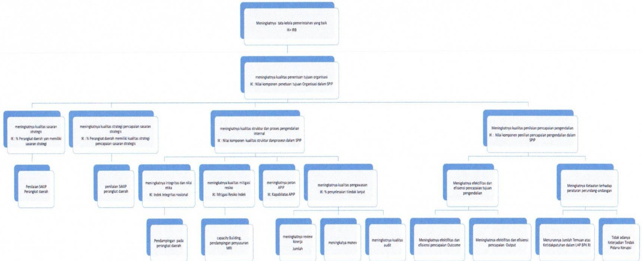
Gambar 4.1 Pohon Kinerja Inspektorat Daerah