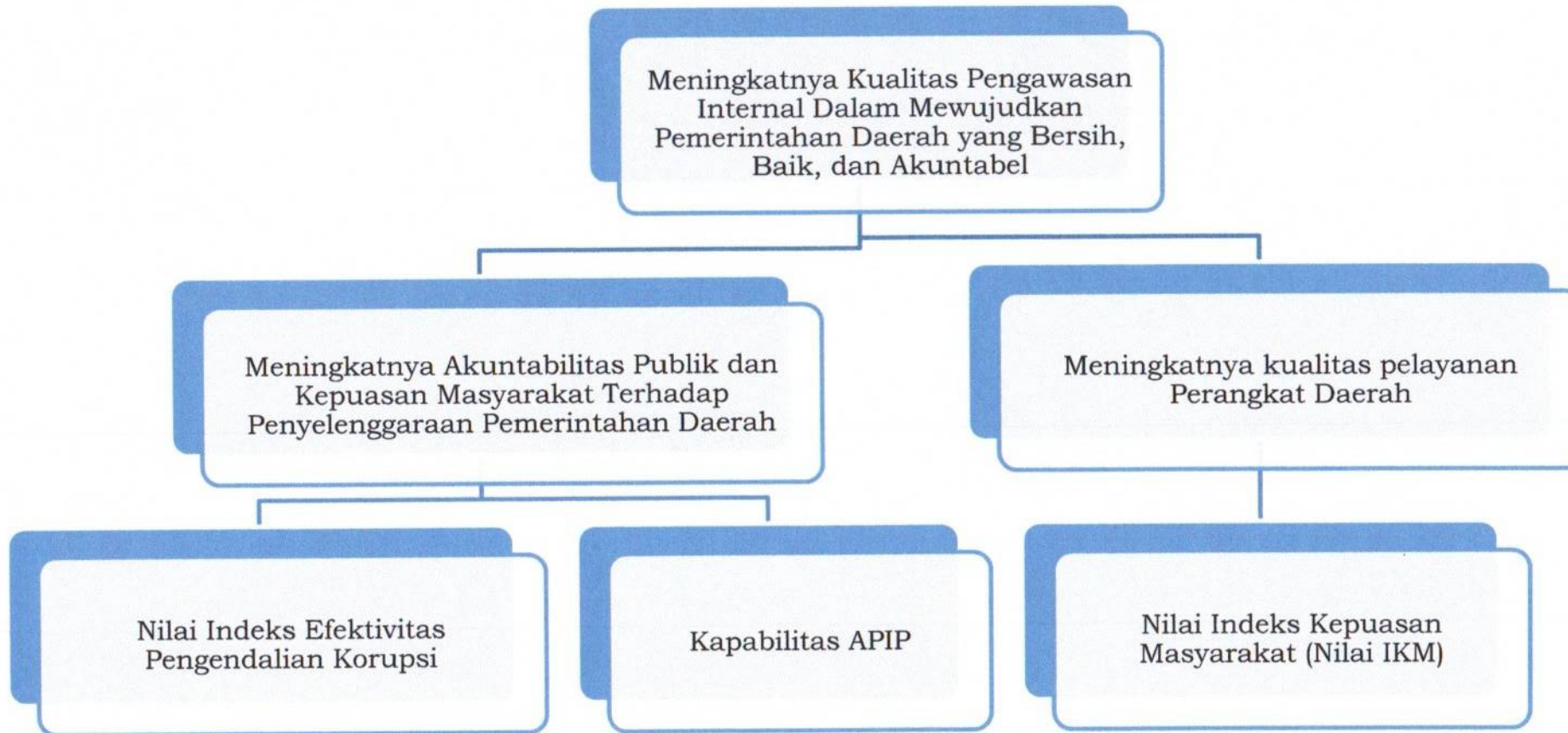
Bagan 3.1 Logframe Inspektorat Daerah Kabupaten Karanganyar Tahun 2025-2029