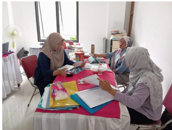
Rapat Pleno Komisioner Panwaslu Kecamatan Tasikmadu yang dihadiri 3 jajaran Komisioner