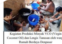
Kegiatan Produksi Minyak VCO (Virgin Coconut Oil) dan Lengis Tanusan oleh warga Rumah Berdaya Denpasar