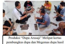
Produksi "Dupa Arusaji" Melipat kertas pembungkus dupa dan Megemas dupa hasil produksi warga Rumah Berdaya Denpasar