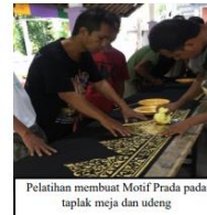
Pelatihan membuat Motif Prada pada taplak meja dan udeng