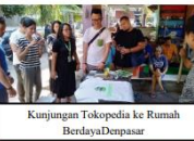
Kunjungan Tokopedia ke Rumah Berdaya Denpasar