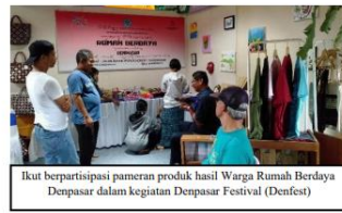
Ikut berpartisipasi pameran produk hasil Warga Rumah Berdaya Denpasar dalam kegiatan Denpasar Festival (Denfest)