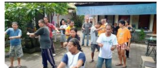
Senam Gembira Warga Rumah Berdaya yang rutin diadakan setiap hari Jumat