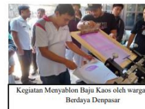
Kegiatan Menyablon Baju Kaos oleh warga Rumah Berdaya Denpasar