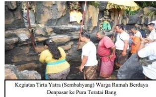
Kegiatan Tirta Yatra (Sembahyang) Warga Rumah Berdaya Denpasar ke Pura Teratai Bang