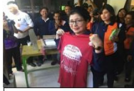
Kunjungan Menteri Kesehatan Republik Indonesia Ibu Nila Djuwita F Moeleok ke Rumah Berdaya Denpasar dalam rangka Serangkaian Kegiatan Ekspose Media Kementerian Kesehatan RI tahun 2019