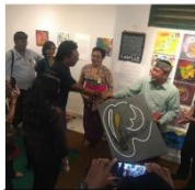
Persiapan Gedung Baru Rumah Berdaya di Jalan Raya Sesetan No. 280 Denpasar Selatan oleh Bapak Sekretaris Daerah Kota Denpasar dan Ibu Walikota Kota Denpasar