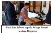
Pelatihan Sablon kepada Warga Rumah Berdaya Denpasar