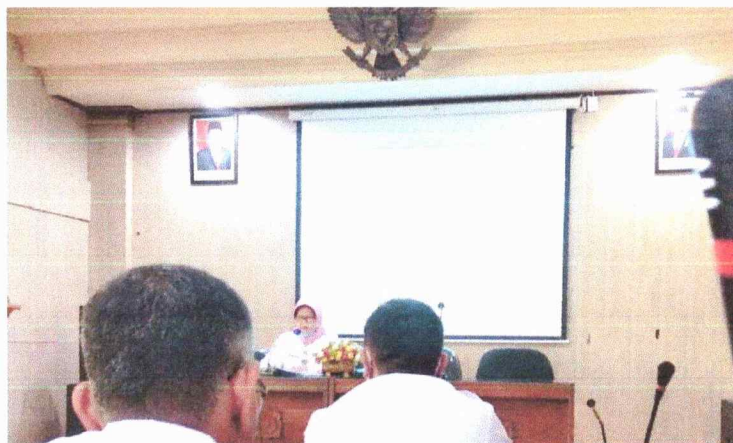
Gambar 4. Kuesioner Penilaian Mandiri Pemeringkatan Keterbukaan Informasi Publik Tingkat Provinsi Jawa Tengah 2022