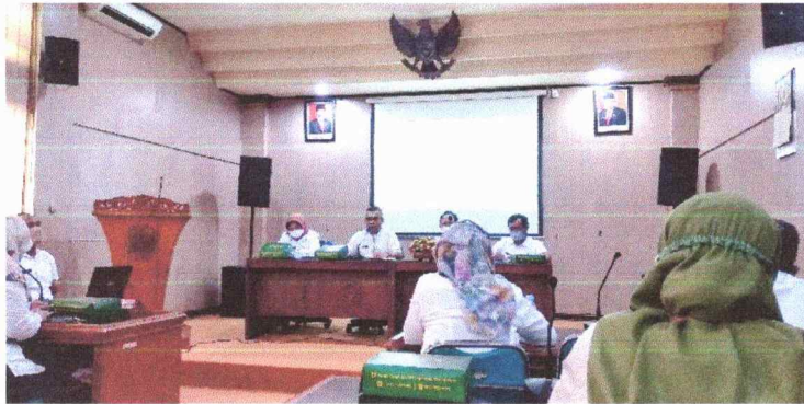
Gambar 3. Uji Konsekuensi dan Informasi yang Dikecualikan