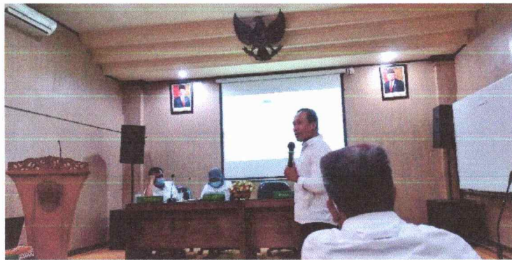
Gambar 1. Meningkatkan Pemahaman Petugas Pelayanan Informasi Publik tentang Perki 1 Tahun 2021