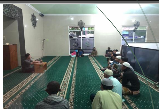
Masjid Al Huda Dusun Tagung