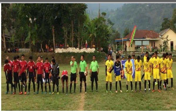
Lapangan Desa Berjo

Letaknya yang berada di dataran tinggi tropis ( \pm 1.500 mdpl), Berjo memiliki suhu rata-rata harian 22-32^{\circ} C. Topologi wilayah Berjo juga beragam, yakni terdiri dari persawahan, perladangan, perkebunan, peternakan, pertambangan atau galian, kerajinan atau industri kecil, serta jasa dan perdagangan dengan luas wilayah 1.623,865 Ha. Di antaranya luas pemukiman 13,398 ha, luas tanah sawah 83,9350 ha, luas ladang 191,865 ha, luas hutan biasa 1.004,7 ha, luas hutan konservasi 231,3 ha, sisanya terdapat rawa-rawa, perkantoran, sekolah, jalan, dan lapangan sepak bola.